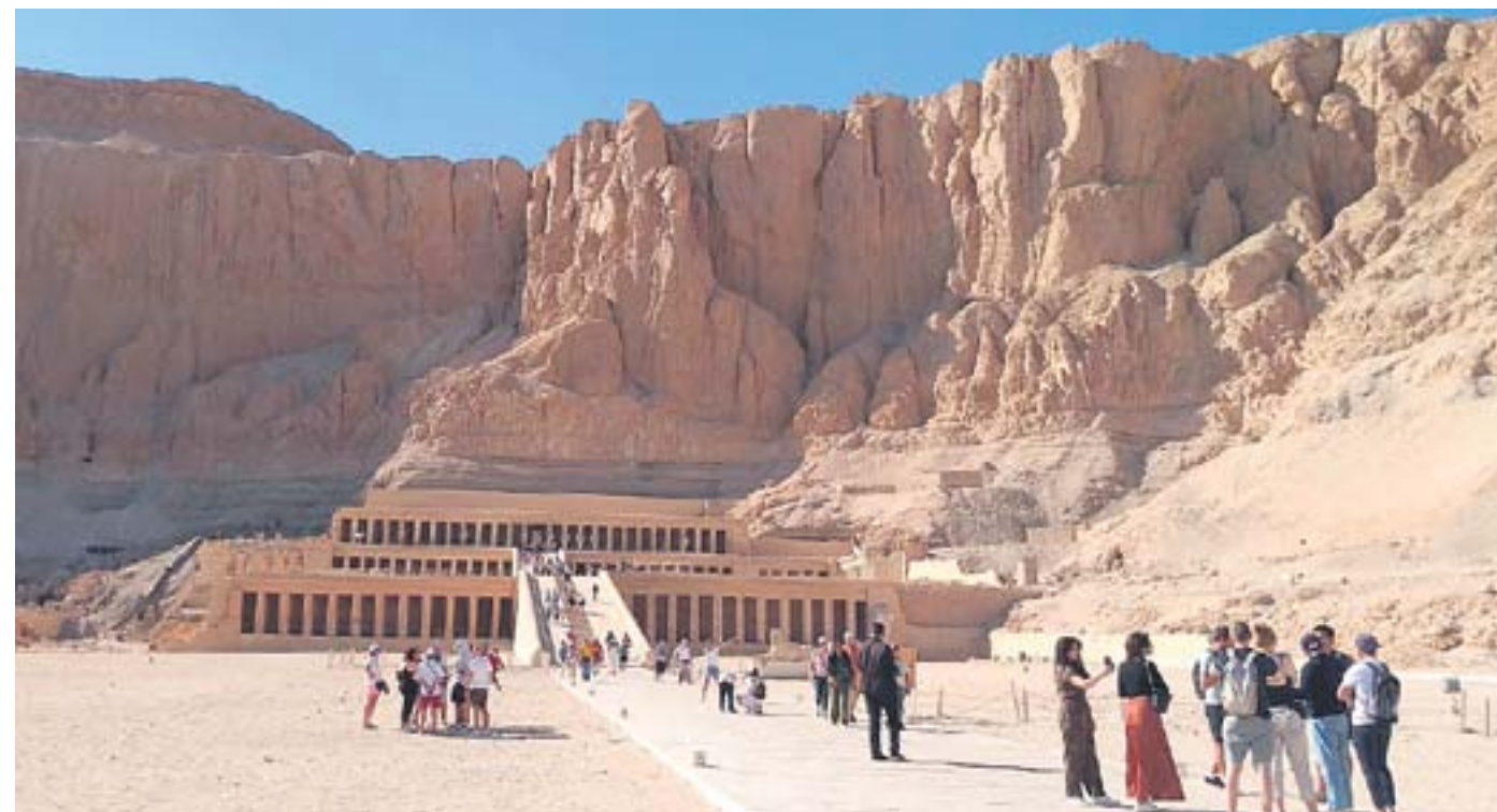
Храмът на Хатшепсут

Все съм виждала колони, но това тук е нещо огромно. На няколко пъти питам екскурзовода защо им са трябвали всички тези наблъскани една до друга колони - обяснението, че държат покрива, не ми е достатъчно. Покривът е бил плосък и на няколко нива, като разликата във височината на огромните колони е използвана за вкарването на светлина в комплекса. Лесно е да си го представиш - отделни части от комплекса са много запазени, но мащабите са огромни и отново ми се струва, че не са предназначени за хора. Тук не издържаме - и на гледката, и на жегата, и сядаме на кафе покрай езерото на комплекса. Нивото му, разказва екскурзоводът, било показателно за определянето на данъците през Новото царство - ако има вода и годината ще е добра, данъците са по-високи, ако е суша - таксите падат. В този наниз от чудеса завършваме пътуването с храма на Хатшепсут - първата жена фараон, управлявала в мир цели 21 години и дала началото на големи строежи. Погребалният храм на Хатшепсут е вграден в скалите на Дейр ел-Бахри и изглежда и непристъпен, и приласкаващ. Като голямата жена, одобрила плана за изграждането на собствения си храм.