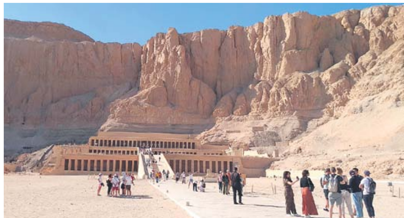
Храмът на Хатшепсут